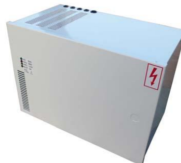
PZD13 připojení svorek